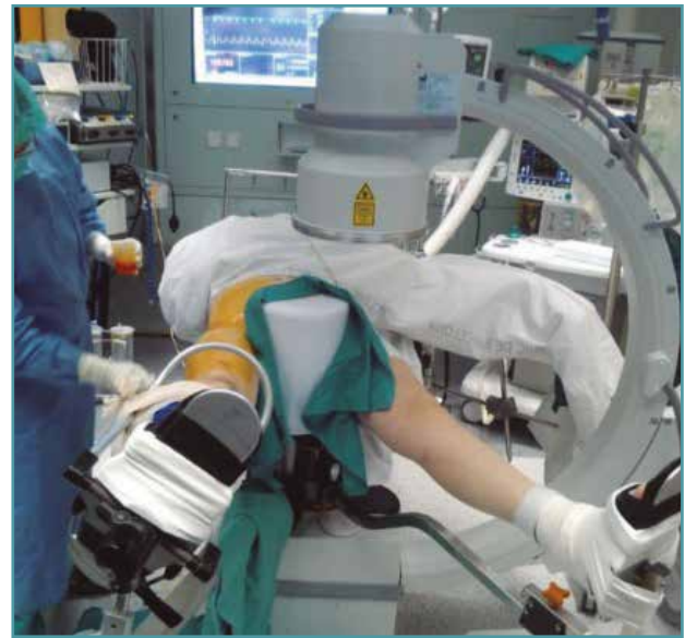
Figura 1. Exposición a radiaciones ionizantes. Se debe minimizar el uso de radiaciones ionizantes, alejarse en lo posible del arco y llevar protección adecuada.

En Cirugía Ortopédica y Traumatología se sigue necesitando del uso de radiaciones ionizantes durante la cirugía ( Figura 1 ). Los efectos de las radiaciones se engloban en 2 categorías: los dependientes de la dosis recibida, denominados efectos no estocásticos, y los independientes de la dosis, denominados efectos estocásticos. Los efectos no estocásticos se pueden evitar si no pasamos de una determinada dosis para un determinado efecto. En cambio, los efectos estocásticos no tienen una dosis límite y pueden acabar traducándose en una neoplasia después de un periodo latente que puede durar de años a décadas dependiendo del tipo de cáncer (2) . No es el objetivo de este apartado repasar todos conceptos básicos de protección y seguridad radiológica (3) . Sin embargo, vemos interesante reseñar algunos hallazgos, con el objetivo de sensibilizar en la maximización de la protección respecto a las radiaciones ionizantes. Por un lado, se ha constatado mayor incidencia de patología oncológica