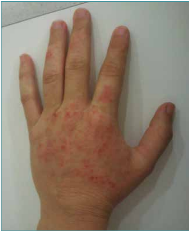
Figura 3. Imagen clínica de dermatitis de contacto de cirujano en mano izquierda. Se aprecian lesiones características localizadas en el dorso de la mano y los dedos.

ocular, nasal y del tracto respiratorio superior en relación con picos de exposición de corto tiempo y en la literatura se han descrito un total de 19 casos más graves que incluyen asma, laringitis o neumonitis por hipersensibilidad (25) . Una de las recomendaciones es que la mezcla del cemento debería realizarse en sistemas de vacío porque disminuye la porosidad del mismo, mejorando sus propiedades mecánicas, pero también porque disminuye la exposición del personal de quirófano. Por otro lado, no se recomienda masajear o toquetear el cemento con los dedos para ir comprobando el fraguado.